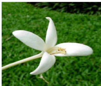
“ภาพที่ ๑.๑.๓ ดอกไม้ประจำจังหวัด คือ ดอกปี่ ชื่อสามัญ Cork Tree”

เป็นรูปต้นโพธิ์ศรีมหาโพธิ์ ปลูกไว้ที่ตำบลโคกปี่ อำเภอสรีมโหสถ เป็นสัญลักษณ์ทางด้านพุทธศาสนาที่ขีดหน้าชูตาของจังหวัดปราจีนบุรี เพราะเชื่อกันว่าเป็นต้นโพธิ์ที่สมณทูตจากอินเดีย ซึ่งมาเผยแพร่พระศาสนา เมื่อราว พ.ศ. ๕๐๐ ได้นำพันธุ์มาจากพระศรีมหาโพธิ์ พุทธคยา ประเทศอินเดีย ซึ่งเป็นต้นโพธิ์ที่พระพุทธเจ้าประทับบำเพ็ญธรรมจนสำเร็จเป็นพระสัมมาสัมพุทธเจ้า ต้นโพธิ์ศรีมหาโพธิ์นี้ เป็นที่นับถือบูชากราบไหว้ของราษฎรในท้องที่และต่างท้องที่ และมีการจัดงานนมัสการเป็นประจำทุกปี