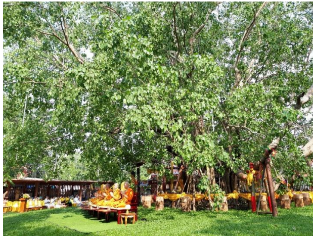
“ภาพที่ ๑.๑.๒ ต้นโพธิ์ศรีมหาโพธิ์ ตำบลโคกปี่ อำเภอสรีมโหสถ”

เมืองปราจีนเริ่มมีความสำคัญมากขึ้นตามลำดับเพราะมีการค้นพบแหล่งทองคำที่เมืองกบินทร์บุรี มีการทำเหมืองทองคำ ต่อมาเมื่อปฏิรูปการปกครองเป็นระบบเทศบาล ได้ใช้เมืองปราจีนเป็นที่ว่าการมณฑลปราจีน ส่งผลให้เมืองปราจีนกลายเป็นศูนย์กลางความเจริญในภูมิภาคตะวันออก ครั้นเมื่อได้ย้ายที่ว่าการมณฑลปราจีนไปอยู่ที่เมืองฉะเชิงเทรา ทำให้เมืองปราจีนลดความสำคัญลง ภายหลังการเปลี่ยนแปลงการปกครอง เมื่อ พ.ศ. ๒๔๗๕ ได้มีพระราชบัญญัติว่าด้วยการบริหารแห่งราชอาณาจักรไทย พ.ศ. ๒๔๗๖ ส่งผลให้มณฑลเทศบาลปราจีนบุรี ถูกยกเลิกจากเมืองปราจีนบุรี มีฐานะเป็นจังหวัดปราจีนบุรี