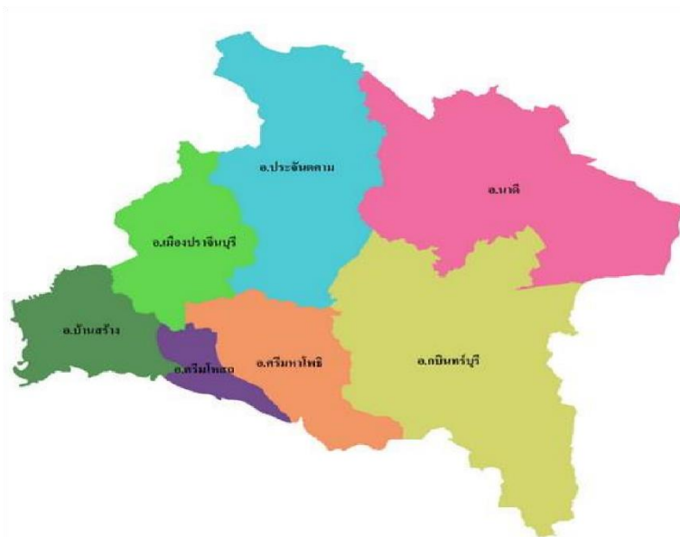
“ภาพที่ ๑.๒.๑ ที่ตั้งและอาณาเขตจังหวัดปราจีนบุรี”