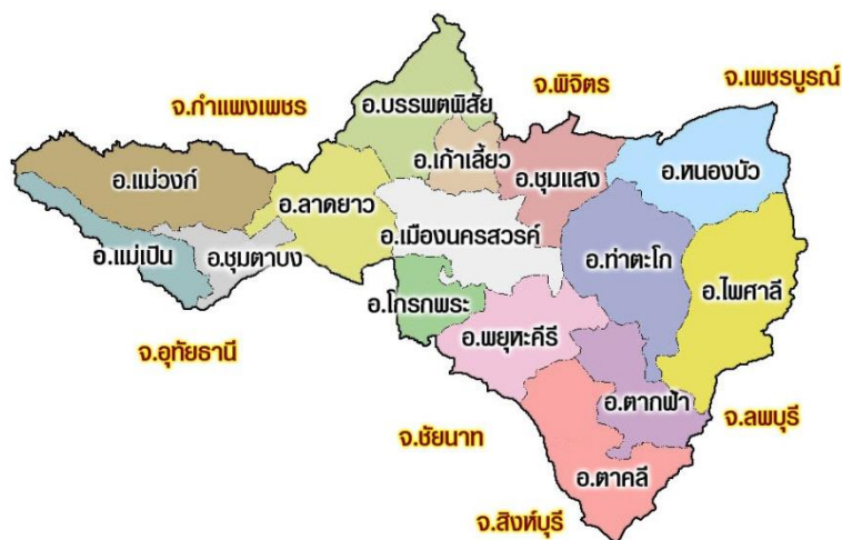
รูปภาพแสดง แผนที่จังหวัดนครสวรรค์ที่แสดงให้เห็นถึงอาณาเขตติดต่อ