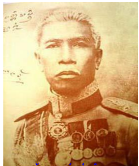
เจ้าบุญวาทย์วงศาธิบดี

จังหวัดลำปางได้ประกาศจัดตั้งเป็นจังหวัดในปี พ.ศ.๒๔๓๕ (สมัยรัชกาลที่ ๕) โดยขึ้นอยู่กับมณฑลพายัพสมัยหนึ่ง (พ.ศ.๒๔๔๓) ต่อมาแยกเป็นมณฑลมหาสารคามในปี พ.ศ.๒๔๕๘ ซึ่งในเวลาต่อมา ได้มีประกาศยกเลิกมณฑลที่วราชอาณาจักร ลำปาง จึงมีฐานะเป็น “จังหวัดลำปาง” ตามพระราชบัญญัติระเบียบบริหารราชการ อาณาจักรสยาม พ.ศ. ๒๔๗๖