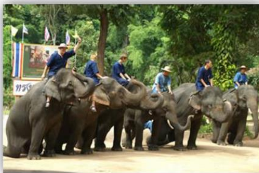
ฝึกช้างใช้ลือโลก