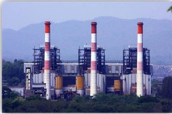
ถ่านหินลือชา

..... "ถ่านหินลือชา รถม้าลือลั่น เครื่องปั้นลือนาม งามพระธาตุลือไกล ฝึกช้างใช้ลือโลก"