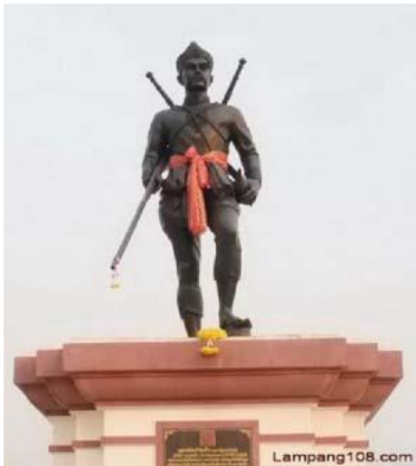
เจ้าทิพย์ช้าง หรือ พระยาสุวโลไชยสงคราม

ภายใต้อำนาจของพม่าเป็นเวลานานร่วมๆ ๒๐๐ ปีเศษ (พ.ศ. ๒๑๐๑ - ๒๓๑๗) และบางครั้งก็อยู่ภายใต้การปกครองของกรุงศรีอยุธยาบ้าง เช่น สมัยสมเด็จพระนเรศวรมหาราช และสมัยสมเด็จพระนารายณ์มหาราช เป็นต้น หากกล่าวโดยสรุป ด้านประวัติความเป็นมาของจังหวัดลำปาง พบว่าจังหวัดลำปางเป็นจังหวัดที่มีอายุเก่าแก่มากไม่น้อยกว่า ๑,๓๐๐ ปี มีชื่อเรียกขานกันหลายชื่อ ซึ่งปรากฏหลักฐานตามตำนานต่าง ๆ รวม ๑๑ ชื่อ ได้แก่ กุกกุกนคร ลัมภักปะนคร ศรีนครชัย นครเวียงคอกว้าว เวียงดิน เขลางค์นคร นครลำปาง คำเขลางค์ อาลัมภางค์ เมืองลคร และเมืองนครลำปาง จากการที่เรียกขานกันว่า “กุกกุกนคร” แปลว่าเมืองไก่ ดังนั้นตราประจำจังหวัดลำปาง คือ “ไก่ขาว” โดยจังหวัดลำปาง สร้างเมื่อ พ.ศ.๑๒๒๓ จากหนังสือพงศาวดารโยนกกล่าวว่า “สุพรมฤชา” สร้างเมืองเพื่อให้ เจ้าอนันตยศ โอรสพระนางจามเทวีครองคู่กับเมืองหริภุญชัย (ลำพูน) ให้ชื่อเมืองว่า “นครเขลางค์” ต่อมาเปลี่ยนเป็น “นครอัมภางค์” และเปลี่ยนชื่อเป็น “นครลำปาง” ในภายหลัง