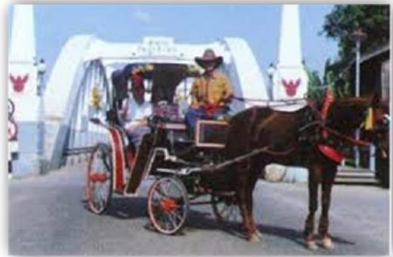
รถม้าลือลั่น