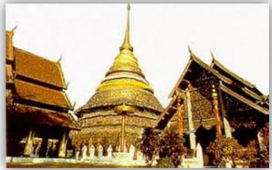
งามพระธาตุลือไกล