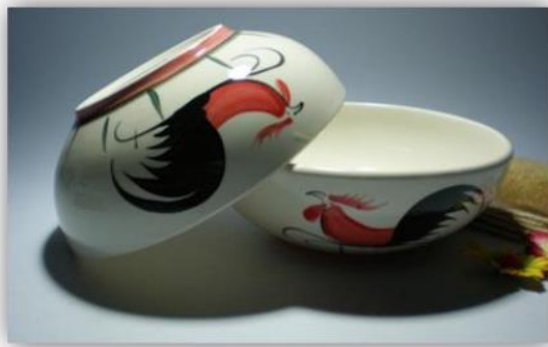
เครื่องปั้นลือนาม