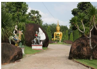
ภาพ: วัดสว่างอารมณ์ (วัดถ้ำศรีธน) อำเภอปากคาด

๕) วัดสว่างอารมณ์ (วัดถ้ำศรีธน) ตั้งอยู่ที่ตำบลปากคาด อำเภอปากคาด วัดตั้งอยู่บริเวณเนินเขา ภายในบริเวณวัดมีโขดหิน หน้าผา ลานหิน มีต้นไม้ปกคลุมทั่วไปเป็นที่ร่มรื่นมีลำธารเล็กๆ ไหลผ่านอุโบสถ ทรงระฆังคว่ำ ตั้งอยู่บนเนินสูงภายในเป็นที่ประดิษฐานพระพุทธรูปศักดิ์สิทธิ์ บนอุโบสถสามารถมองเห็น ทิวทัศน์รอบด้านทั้งทางฝั่งไทยและฝั่งลาว