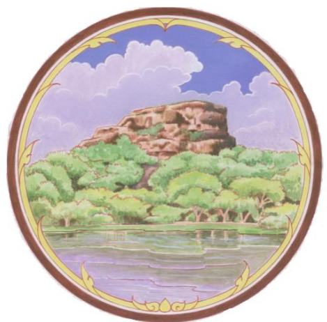
ภาพ: เครื่องหมายราชการประจำจังหวัดบึงกาฬ (ตราประจำจังหวัดบึงกาฬ)

คำอธิบาย : ภูเขา หมายถึง ภูทอก ซึ่งเป็นแหล่งท่องเที่ยวและสถานที่ปฏิบัติธรรมของจังหวัด พื้นน้ำ หมายถึง แหล่งน้ำที่สำคัญเป็นทั้งแหล่งท่องเที่ยวและแหล่งปฏิบัติธรรมใน