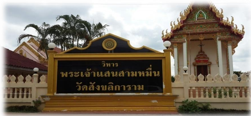
ภาพ : วัดสังขลิการาม อำเภอโศกพิสัย

๖) วัดสังขลิการาม อำเภอโศกพิสัย เป็นวัดที่ประดิษฐานพระเจ้าแสนสามหมื่น ซึ่งเป็นพระพุทธรูปสร้างในสมัยเชียงแสนเป็นราชธานี ประมาณ ๘๐๐ ปีมาแล้ว เจ้าอนุวงศ์แห่งนครเวียงจันทน์ ได้อัญเชิญพระเจ้าแสนสามหมื่น มาประดิษฐานไว้ในหอไตร (เวียงจันทน์) ในขณะที่นครเวียงจันทน์นั้นทำสงครามกับข้าศึก ชาวบ้านจึงนำพระพุทธรูป พระสุก พระเสริม พระใส พระแสน และพระเสียง หลบข้าศึกล่องแพตามลำน้ำจันทมาเรื่อย ๆ เกิดแพแตก แพ่นพระสุก ตกลงไปในน้ำ ที่บริเวณนั้นชาวบ้านจึงเรียกว่าบ้านเวินแพ่นและเมื่อล่องเรือมาถึงปากน้ำจันทเกิดแพแตกอีก พระสุกได้ตกลงน้ำได้สูญหายไป บริเวณพระสุกตกน้ำนั้นเรียกว่าเวินสุก ต่อมาเมื่อซ่อมแพเสร็จแล้วจึงนำแพล่องมาถึงโพนพิสัย ชาวโพนพิสัยจึงอัญเชิญพระเจ้าแสนสามหมื่นกับพระเสียงไว้ที่วัดนิโคตร และเมื่อแพได้ล่องมาถึงหนองคายชาวหนองคายจึงได้อัญเชิญพระใสประดิษฐานไว้ที่วัดโพธิ์ชัย ส่วนพระเสริมนั้นได้อัญเชิญไปประดิษฐานที่วัดประทุมวาราม กรุงเทพฯ เจ้าอธิการจันท์ มังศรี ได้ไปอัญเชิญพระเจ้าแสนสามหมื่นจากโพนพิสัยมาประดิษฐานไว้ที่บ้านโศก