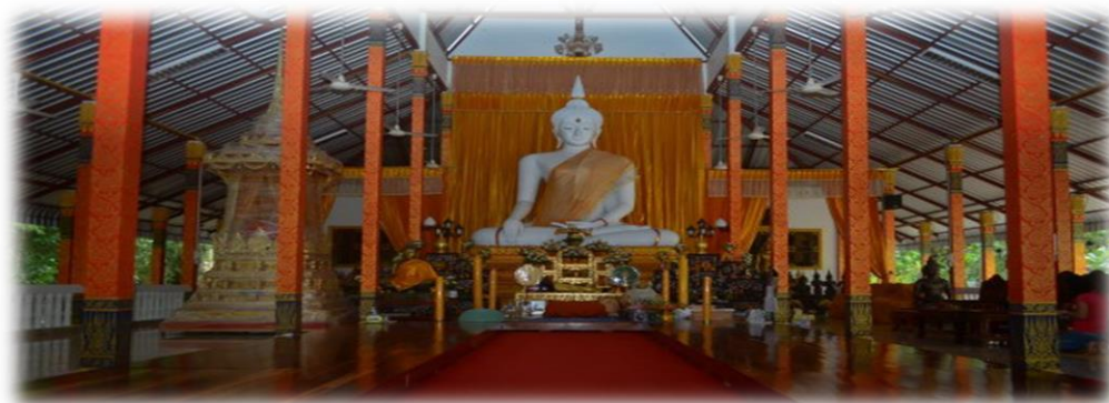
วัดเชกาเจติยาราม (พระอารามหลวง) อำเภอลำลูกกา จังหวัดบึงกาฬ