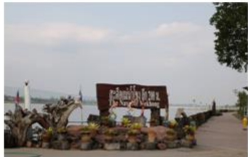
ภาพ: วัดอาฮงศิลาวาส อำเภอเมืองบึงกาฬ

๓) ศาลเจ้าแม่สองนาง อำเภอเมืองบึงกาฬ ศาลเจ้าแม่สองนาง จะเป็นศาลที่ผู้คนใน แถบลุ่มแม่น้ำโขง ให้ความเคารพศรัทธา ในตัวเมืองใหญ่ ๆ ที่อยู่ริมแม่น้ำโขง จะมีศาลเจ้าแม่สองนางให้คนกราบไหว้บูชาเสมอ เช่น ศาลเจ้าแม่สองนางวัดหายโศก จังหวัดหนองคาย ศาลเจ้าแม่สองนาง จังหวัดมุกดาหาร เป็นต้น แต่ประวัติความเป็นมาของเจ้าแม่สองนาง ในแต่ละท้องถิ่นก็มีการเล่าขานแตกต่างกันไปแต่เนื้อหามีลักษณะตรงกัน ก็คือ เป็นกษัตริย์ หรือ ชาวล้านช้าง ที่มีลูกสาวสองคน อพยพหนีข้าศึก ล่องมาตามแม่น้ำโขง แล้วประสบอุบัติเหตุ เสียชีวิต แล้วกลายเป็นพญานาคคอยปกป้องรักษา ผู้คนที่อาศัยลำน้้ำโขงในการทำมาหากิน ค้าขาย หรือเดินทาง ทำให้เป็นที่เคารพศรัทธา ของประชาชนทั้งสองฝั่งแม่น้ำโขง