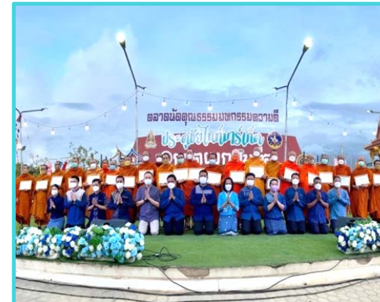
จังหวัดคุณธรรม

ส่วนราชการระดับอำเภอ องค์กรปกครอง ส่วนท้องถิ่น ภาคธุรกิจ ภาคเอกชน ชุมชน สถาบันทางศาสนา สมาคม มูลนิธิ และทุกภาคส่วน ซึ่งอยู่ในเขตพื้นที่อำเภอนั้น เข้ามามีส่วนร่วมในการแสดงเจตนารมณ์ และมุ่งมั่นที่จะดำเนินการส่งเสริม และพัฒนาคุณธรรมในอำเภอ