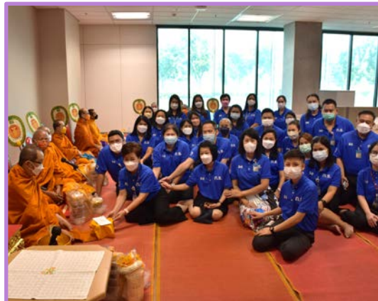
องค์กรคุณธรรม

องค์กรหรือหน่วยงาน ที่ผู้นำ และสมาชิกขององค์กร แสดงเจตนารมณ์ และมุ่งมั่นที่จะ ดำเนินการส่งเสริม และพัฒนาคุณธรรมในองค์กร