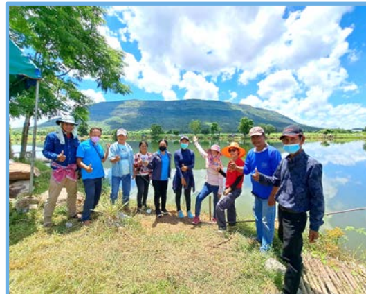
อำเภอคุณธรรม

ส่วนราชการระดับอำเภอ องค์กรปกครอง ส่วนท้องถิ่น ภาคธุรกิจ ภาคเอกชน ชุมชน สถาบันทางศาสนา สมาคม มูลนิธิ และทุกภาคส่วน ซึ่งอยู่ในเขตพื้นที่อำเภอนั้น เข้ามามีส่วนร่วมในการแสดงเจตนารมณ์ และมุ่งมั่นที่จะดำเนินการส่งเสริม และพัฒนาคุณธรรมในอำเภอ