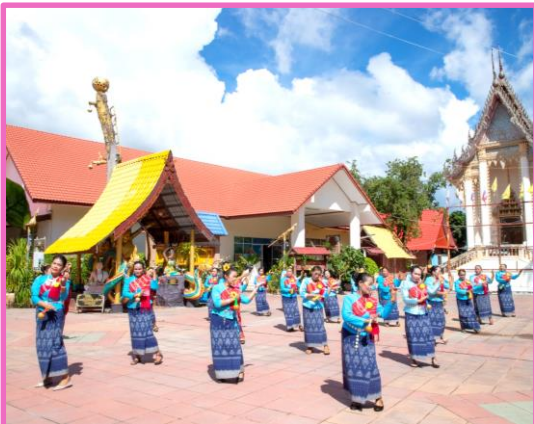
ชุมชนคุณธรรม

ชุมชนที่อยู่รวมกันเป็นหมู่บ้าน ตาม พ.ร.บ.ลักษณะปกครองท้องที่ พุทธศักราช ๒๔๕๗ และแก้ไขฉบับที่ ๑๒ หรืออยู่รวมกันโดยธรรมชาติ เพื่อทำกิจกรรมร่วมกัน มีระบบความสัมพันธ์ ไม่เป็นทางการ และมีวัฒนธรรมที่หลากหลาย