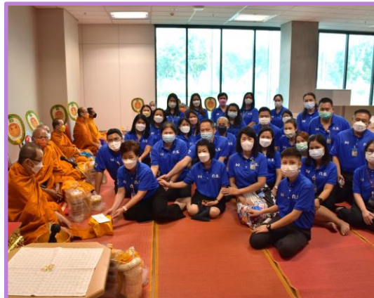
องค์กรคุณธรรม

แบ่งตามพื้นที่เป็น 2 ส่วน คือ • ชุมชนที่ตั้งอยู่ในพื้นที่จังหวัด • ชุมชนที่ตั้งอยู่ในกรุงเทพฯ