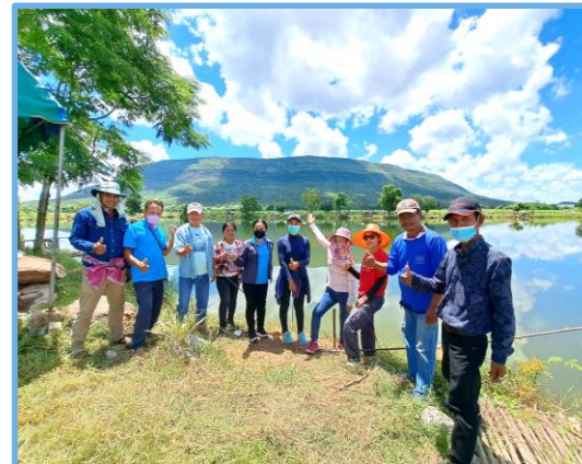
อำเภอคุณธรรม

แบ่งตามพื้นที่เป็น 2 ส่วน คือ • องค์กรที่ตั้งอยู่ในพื้นที่จังหวัด • องค์กรที่ตั้งอยู่ในส่วนกลางและองค์กรในสังกัด กทม.