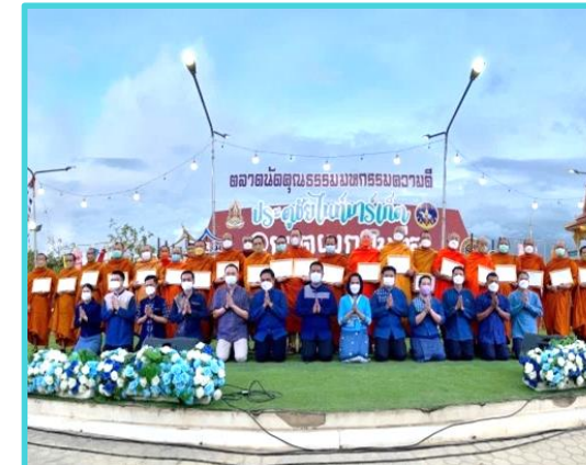
จังหวัดคุณธรรม

ส่วนราชการระดับอำเภอ องค์กรปกครอง ส่วนท้องถิ่น ภาคธุรกิจ ภาคเอกชน ชุมชน สถาบันทางศาสนา สมาคม มูลนิธิ และทุกภาคส่วน ซึ่งอยู่ในเขตพื้นที่อำเภอนั้น เข้ามามีส่วนร่วมในการแสดงเจตนารมณ์ และมุ่งมั่นที่จะดำเนินการส่งเสริม และพัฒนาคุณธรรมในอำเภอ