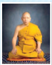
พระพรหมชิวริญาณ (ปลสุทธ์ เขมงก์โร) วัดยานนาวา