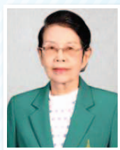
ศาสตราจารย์กิตติคุณ สุนน อมรวิวัฒน์