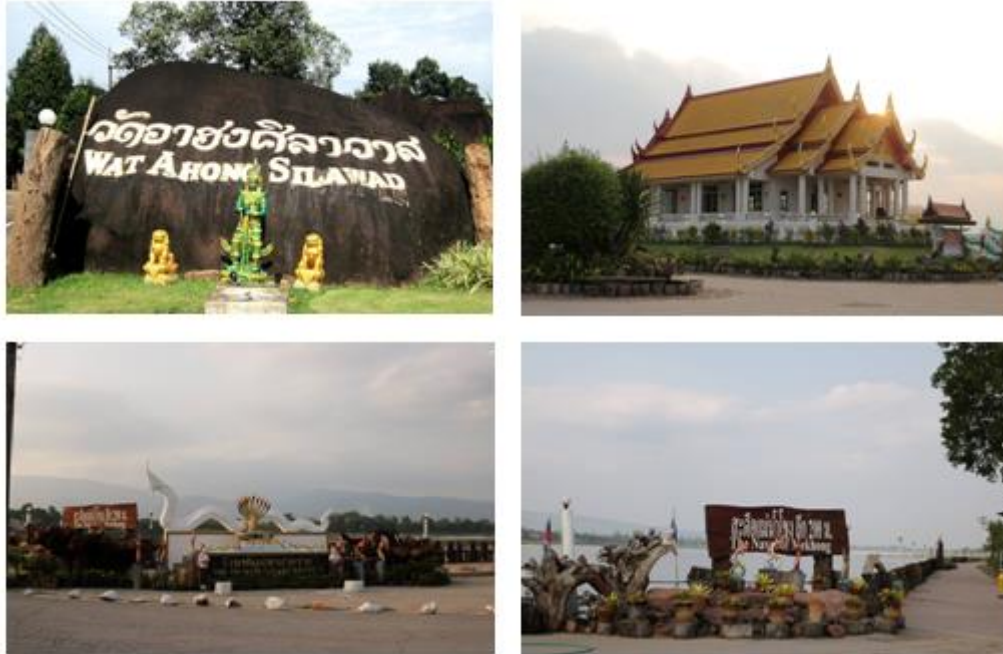
ภาพ: วัดอาฮงศิลาวาส อำเภอเมืองบึงกาฬ

สวายนอกจากเป็นสถานที่พักผ่อนและท่องเที่ยวแล้วเป็นสถานที่เกิดปรากฏการณ์ทางธรรมชาติ คือ บั้งไฟพญานาค จะเกิดขึ้นในวันขึ้น ๑๕ ค่ำ เดือน ๑๑ ซึ่งปฏิทินไทยตรงกับปฏิทิน สปป.ลาว