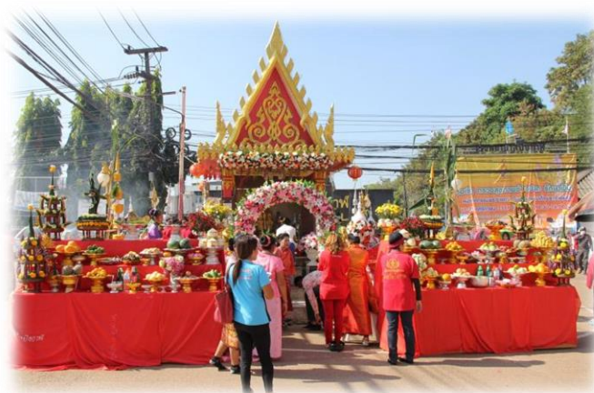
ภาพ: ศาลเจ้าแม่สองนาง อำเภอเมืองบึงกาฬ

๓) ศาลเจ้าแม่สองนาง อำเภอเมืองบึงกาฬ ศาลเจ้าแม่สองนาง จะเป็นศาลที่ผู้คนใน แถบลุ่มแม่น้ำโขง ให้ความเคารพศรัทธา ในตัวเมืองใหญ่ ๆ ที่อยู่ริมแม่น้ำโขง จะมีศาลเจ้าแม่สองนางให้คนกราบไหว้บูชาเสมอ เช่น ศาลเจ้าแม่สองนางวัดหายโศก จังหวัดหนองคาย ศาลเจ้าแม่สองนาง จังหวัดมุกดาหาร เป็นต้น แต่ประวัติความเป็นมาของเจ้าแม่สองนาง ในแต่ละท้องถิ่นที่มีการเล่าขานแตกต่างกันไปแต่เนื้อหามีลักษณะตรงกัน ก็คือ เป็นกษัตริย์ หรือ ชาวล้านช้าง ที่มีลูกสาวสองคน อพยพหนีข้าศึก ล่องมาตามแม่น้ำโขง แล้วประสบอุบัติเหตุ เสียชีวิต แล้วกลายเป็นพญานาคคอยปกป้องรักษา ผู้คนที่อาศัยลำนํ้าโขงในการทำมาหากิน คำขाय หรือเดินทาง ทำให้เป็นที่เคารพศรัทธา ของประชาชนทั้งสองฝั่งแม่น้ำโขง