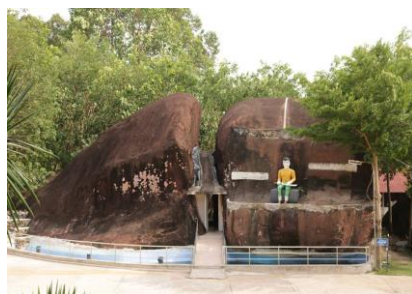
ภาพ: วัดสว่างอารมณ์ (วัดถ้ำศรีธน) อำเภopakคาคัด