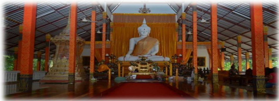
วัดเชกาเจติยาราม (พระอารามหลวง) อำเภอเซกา จังหวัดบึงกาฬ