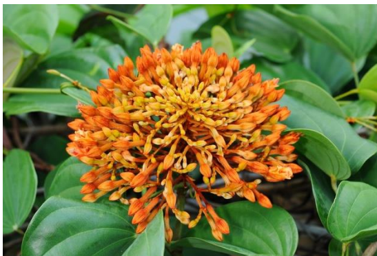
ภาพ: ดอกสิรินธรวัลลี หรือดอกสามสิบสองประดง

คำอธิบาย: สิรินธรวัลลี หรือชื่อพื้นเมือง สามสิบสองประดง ชื่อวิทยาศาสตร์ Bauhinia sirindhorniae K. & S.S. Larsen อยู่ในวงศ์ LEGUMINOSAE – CAESALPINIOIDEAE เป็นพืชถิ่นเดียว และ