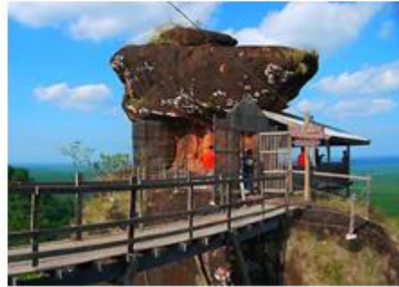
ภาพ: ภูทอก อำเภอสรีวิไล

๕) วัดสว่างอารมณ์ (วัดถ้ำศรีธน) ตั้งอยู่ที่ตำบลปากคาด อำเภopakคาคัด วัดตั้งอยู่บริเวณเนินเขา ภายในบริเวณวัดมีโขดหิน หน้าผา ลานหิน มีต้นไม้ปกคลุมทั่วไปเป็นที่ร่มรื่นมีลำธารเล็กๆ ไหลผ่านอุโบสถทรงระฆังคว่ำ ตั้งอยู่บนเนินสูงภายในเป็นที่ประดิษฐานพระพุทธรูปศักดิ์สิทธิ์ บนอุโบสถสามารถมองเห็นทิวทัศน์รอบด้านทั้งทางฝั่งไทยและฝั่งลาว