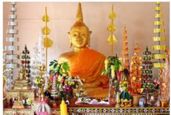
ภาพ: หลวงพ่อพระใหญ่ วัดโพธาราม อำเภอเมืองบึงกาฬ

๒) วัดอาฮงศิลาวาส อำเภอเมืองบึงกาฬ ตั้งอยู่บนเนื้อที่ประมาณ ๘๐ ไร่ บ้านอาฮง ตำบลโคสี อำเภอเมืองบึงกาฬ จังหวัดบึงกาฬ ห่างจากอำเภอเมืองบึงกาฬ ๒๑ กิโลเมตร วัดอาฮงศิลาวาส เป็นวัดเก่าแก่แต่ไม่ปรากฏหลักฐานแน่ชัดว่า เริ่มก่อตั้งขึ้นเมื่อใด จากคำบอกเล่า ทราบแต่เพียงว่าเดิมเป็นสำนักสงฆ์ และเนื่องจาก วัดตั้งอยู่ในป่าที่รกทึบ จึงเรียกว่า “วัดป่า” หลวงพ่อลุน เป็นผู้ก่อตั้ง ได้มรณะไปเมื่อปี พ.ศ.๒๕๐๖ ด้วยโรคชรา หลังจากนั้นเป็นต้นมาก็ไม่มีพระภิกษุสงฆ์มาจำพรรษาอีกเลย จะมีเพียงพระธุดงค์ที่จาริกผ่านมาพักบำเพ็ญเพียรภาวนาชั่วคราวครั้งชั่วคราว ภายในวัดอาฮงศิลาวาสจะมีแก่งอาฮง เป็นแก่งหินกลางลำน้ำโขงบริเวณหน้าวัด อาฮงศิลาวาสบ้านอาฮง ตำบลหอคำ อำเภอเมืองบึงกาฬ ถือว่าเป็นจุดของแม่น้ำที่มีความลึกสุดกระแสน้ำ บริเวณแก่งอาฮงจะไหลเชี่ยวมากในฤดูน้ำหลากและมีกระแสน้ำไหลวนเป็นรูปกรวยขนาดใหญ่ เชื่อกันว่าเป็น “สะดือแม่น้ำโขง” และในฤดูน้ำลดสามารถมองเห็นแก่งได้ในช่วงเดือนมีนาคม - พฤษภาคมของ ทุกปี และ กลุ่มหินที่ปรากฏบริเวณแก่งอาฮงจะมีชื่อเรียกตามลักษณะของหิน เช่น หินลิ้น หินนาค หินปลาเซ่ ถ้าปลา